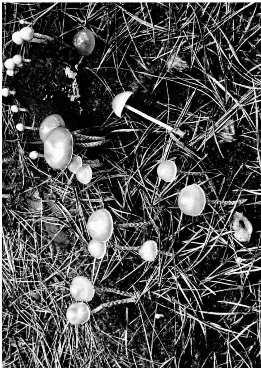
Naematoloma dispersum (Fr.) Karst.