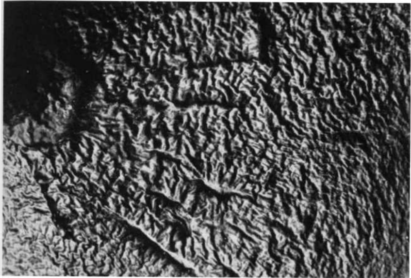
Abb. 1. Polyporus badius : Hutoberfläche eines jüngeren getrockneten Fruchtkörpers mit konzentrischen Wellen und gratigen Leisten (untere Bildhälfte). Huttrichter links oben. 2,5 x vergr.

ner), die samtige ( melanopus ) bzw. kahle ( picipes ) Hutoberfläche oder das Vorhandensein einer Kutis aus klebrigen Hyphen bei picipes , die bei melanopus fehlen soll, die Stielbekleidung, die Porengröße, die Größe von Sporen und Basidien sowie die Breite der Hyphen und schließlich den Standort ( picipes an Baumstämmen, melanopus am Boden an Wurzeln oder vergrabenen Holz).